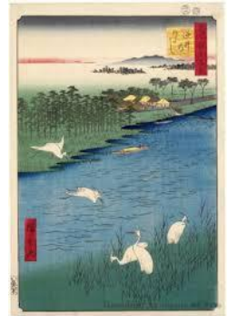
逆井の渡し「昔のイメージ」

【ホームページ】 http://edogawaguide.web.fc2.com/