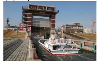
荒川ロックゲート